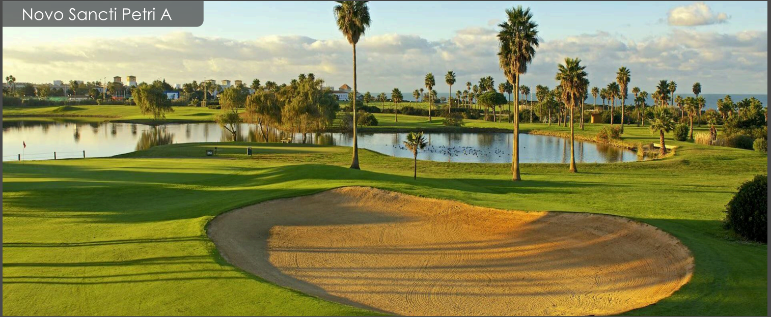
Novo Sancti Petri A