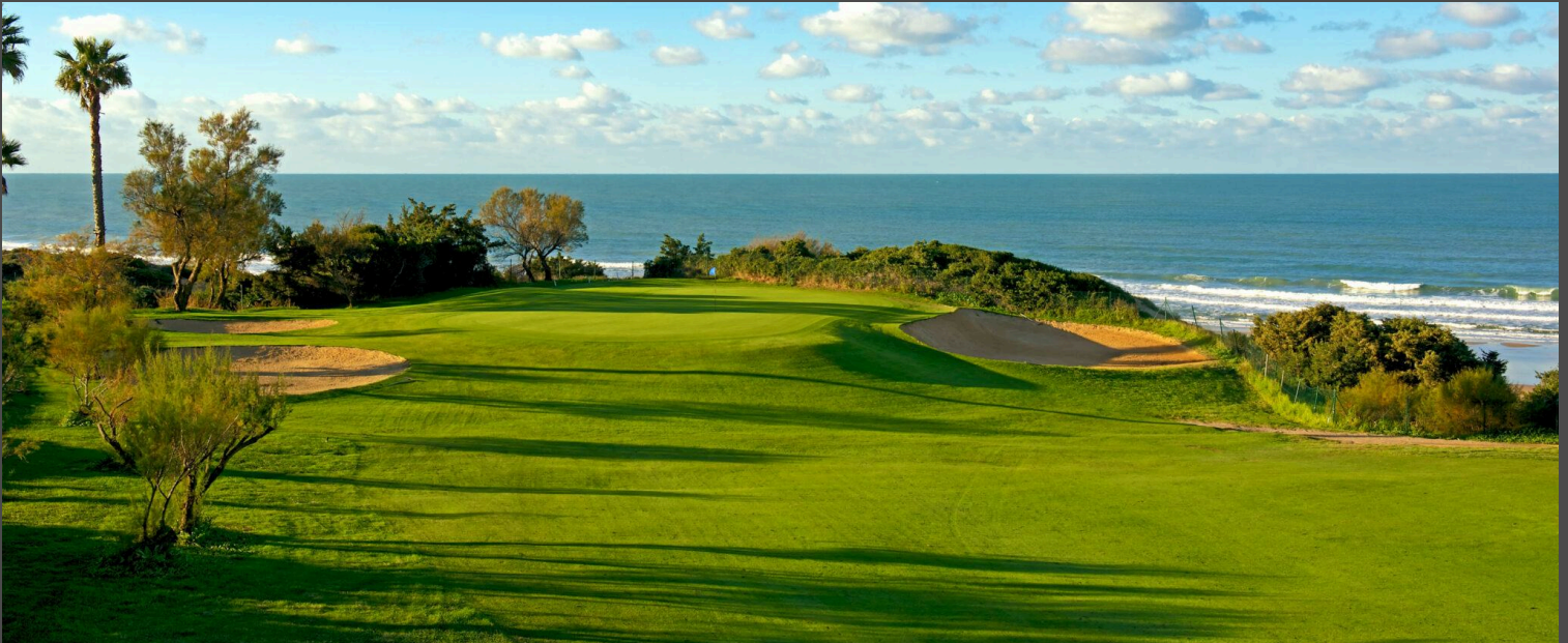
Novo Sancti Petri B